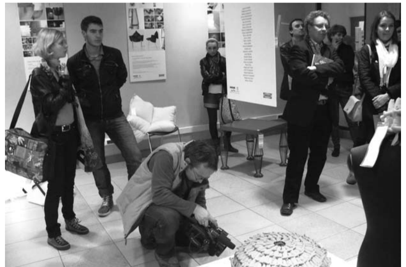
Chętnych, by sprawdzić na wystawie co wyszło z eksperymentu, nie brakowało.