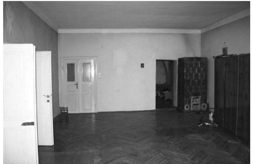
Lokal mieszkalny do zbycia w budynku pod adresem Rynek 4

Burmistrz Miasta Cieszyna informuje, że przeznaczono do zbycia, w trybie bezprzetargowym na rzecz aktualnych najemców: