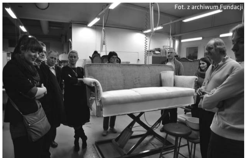
Fundacji „Być Razem” udało się nawiązać współpracę z fińskimi przedsiębiorcami

przedsiębiorstw społecznych w Finlandii oraz tamtejszym systemem wsparcia dla podmiotów ekonomii społecznej. Grupa zwiedziła przedsiębiorstwa: TEAK (zajmujące się wdrażaniem najnowocześniejszych metod obróbki drewna i z którym, w wyniku wizyty, zostało zawiązane partnerstwo), ES Kokkosäitiö i ES Jupiter. Bezpośrednim efektem wizyty było przekazanie fundacji przez przedsiębiorstwo TEAK maszyn stolarskich, a także organizacja szkoleń w Finlandii dla pracowników fundacji, pomoc fundacji we wprowadzaniu na fiński rynek produktów marki WellDone, przekazanie praw autorskich do jednego z produktów przedsiębiorstwa TEAK dla fundacji oraz deklaracja o wspólnej realizacji projektów (przedsiębiorstwo TEAK zdecydo-