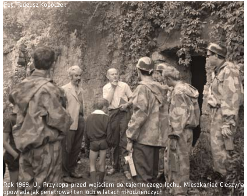
Rok 1969. Ul. Przykopa przed wejściem do tajemniczego lochu. Mieszkaniec Cieszyna opowiada jak penetrował ten loch w latach młodzieńczych

Nr 20 (676) Fragment kolejnego listu: „Jako 14-letni chłopak wraz z kolegami zwiędziłem 2 piwnice mieszczące się pod Browarem. Jedna była zajęta, druga pusta. Po rozbiciu ściany okazało się, że z piwnicy prowadzi przejście pro-