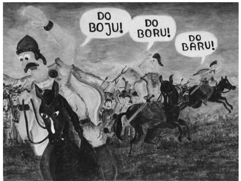
Jedna z prac, jaką można zobaczyć na wystawie w Bibliotece

Café Muzeum oraz Muzeum Śląska Cieszyńskiego zapraszają na Artystyczne Kiermasze Grudniowe: Artystyczny Kiermasz Mikołajkowy w dniach 3-4 grudnia, warsztaty pod tytułem „Choinka piernikiem zdobiona” w dniu 3 grudnia i Artystyczny Kiermasz Świąteczny w dniach 16-20 grudnia.