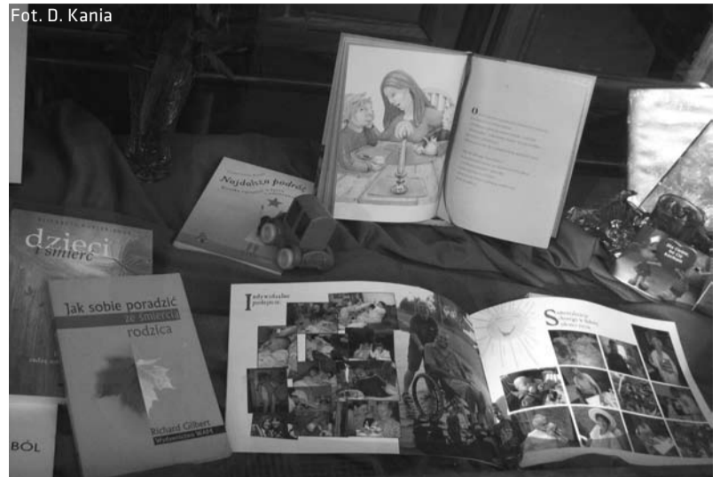
Przykłady dostępnej literatury hospicyjnej