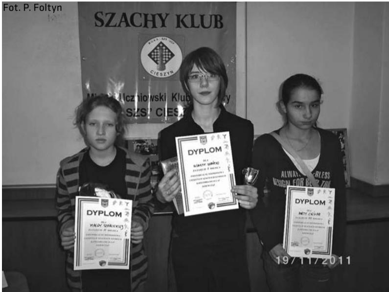
Trzy najlepsze szachistki w swojej kategorii wiekowej 11-18 lat