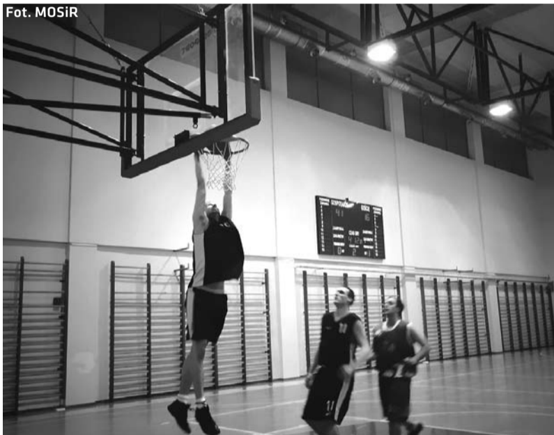
Koszykarzom z KS MOSiR udało się w Rybniku pokonać rywali