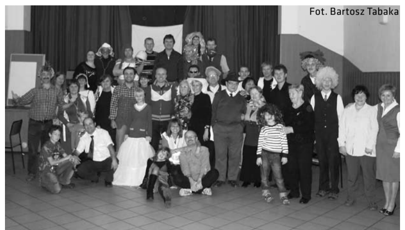
Uczestnicy zabawy zorganizowanej przez Koło cieszyńskie Polskiego Związku Głuchych