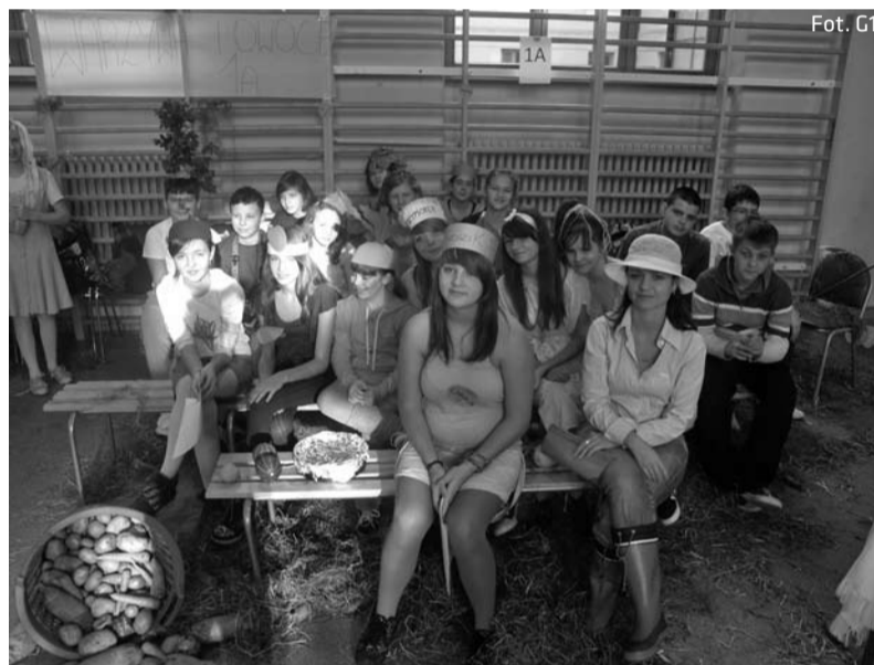
Otrzęsiny klas pierwszych - uczniowie 1a przebrani za... sałatkę owocowo-warzywną